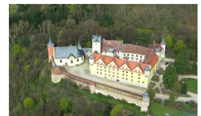
Schloss Schwarzenberg, Scheinfeld