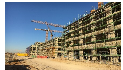
Neubau Bürogebäude, GFK, Nürnberg