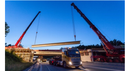
BAB A3, Frankfurt-Nürnberg Teilerneuerung Überführung