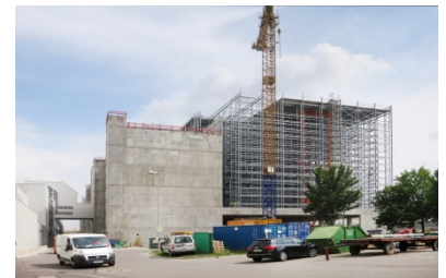
Neubau Hochregallager, Audi AG, Ingolstadt

Gerne steht Ihnen Herr Krafft für Rückfragen unter der Telefonnummer 0911 544289-6 zur Verfügung. Bitte sprechen Sie uns an!