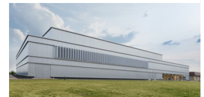
Neubau Physical Fitness Center, Katterbach