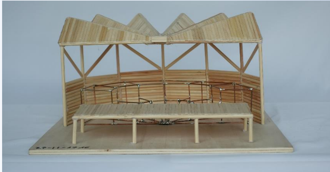
RP-II-1716 Der Fächer von Katzenellenbogen