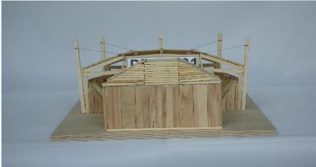
RP-II-721 Wood Arena