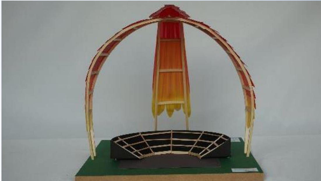
RP-I-2556 Phönix Stage