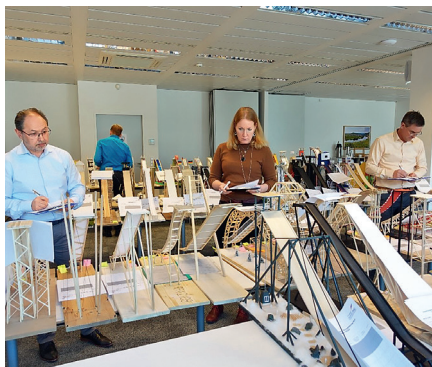
117 kreative Stadionsdachmodelle erbaut von 276 Schülerinnen und Schülern aus Rheinland-Pfalz musste die fachkundige Jury prüfen und bewerten.