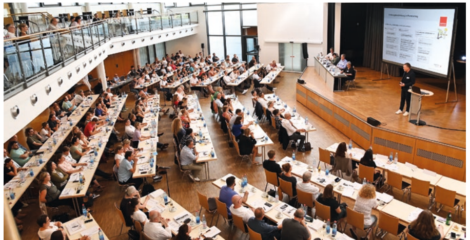
Der Vergabetag fand mit rund 250 Teilnehmerinnen und Teilnehmern in der Ludwig-Eckes-Festhalle in Nieder-Olm statt.

Der Vergabetag bot den Teilnehmerinnen und Teilnehmern einmal mehr die Möglichkeit, sich über die aktuellen Entwicklungen im Vergaberecht zu informieren und förderte darüber hinaus den gegenseitigen Austausch.